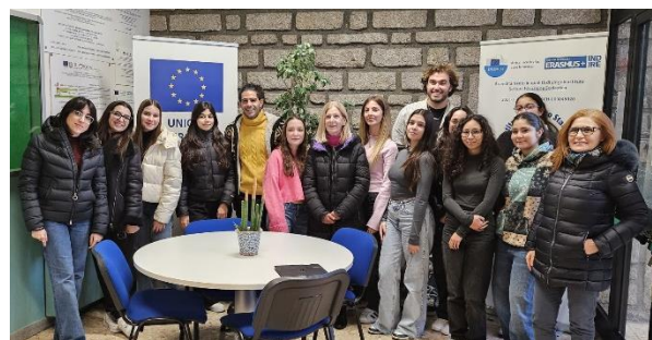
Il gruppo Erasmus+ Ungheria "Ready, steady, go!"