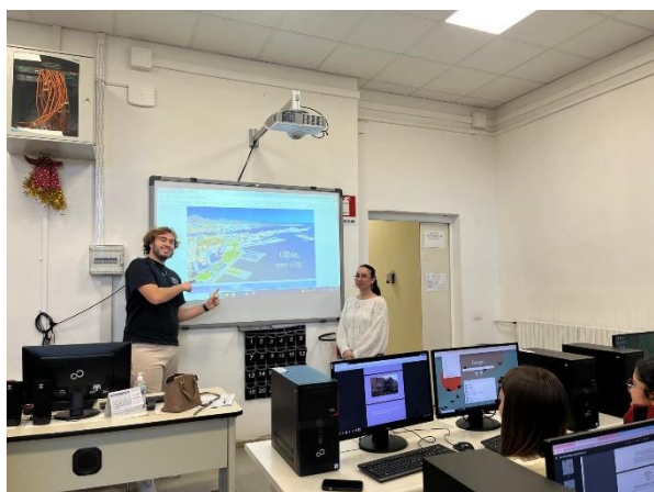
Attività laboratoriali pre-mobilità al Panedda