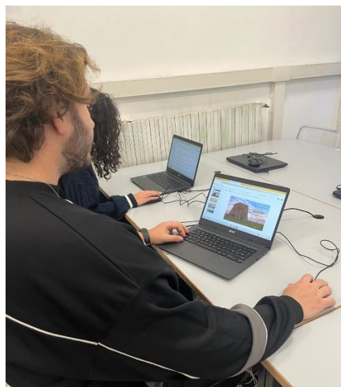
Attività di ricerca sulla storia nuragica

ungheresi, e scoprire i principali aspetti della cultura ungherese.