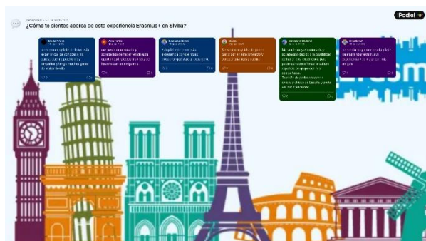
Attività laboratoriali pre-mobilità al Panedda