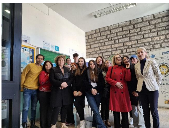
Staff, Studenti e Famiglie Erasmus+ Spagna

Il programma didattico relativo alla settimana di mobilità in Spagna è stato presentato alle famiglie del Panedda a conclusione di una serie di incontri, svoltisi da remoto con il Team Erasmus+ della scuola ospitante e le studentesse spagnole che accoglieranno i nostri sei studenti ad Alcalá de Guadaíra